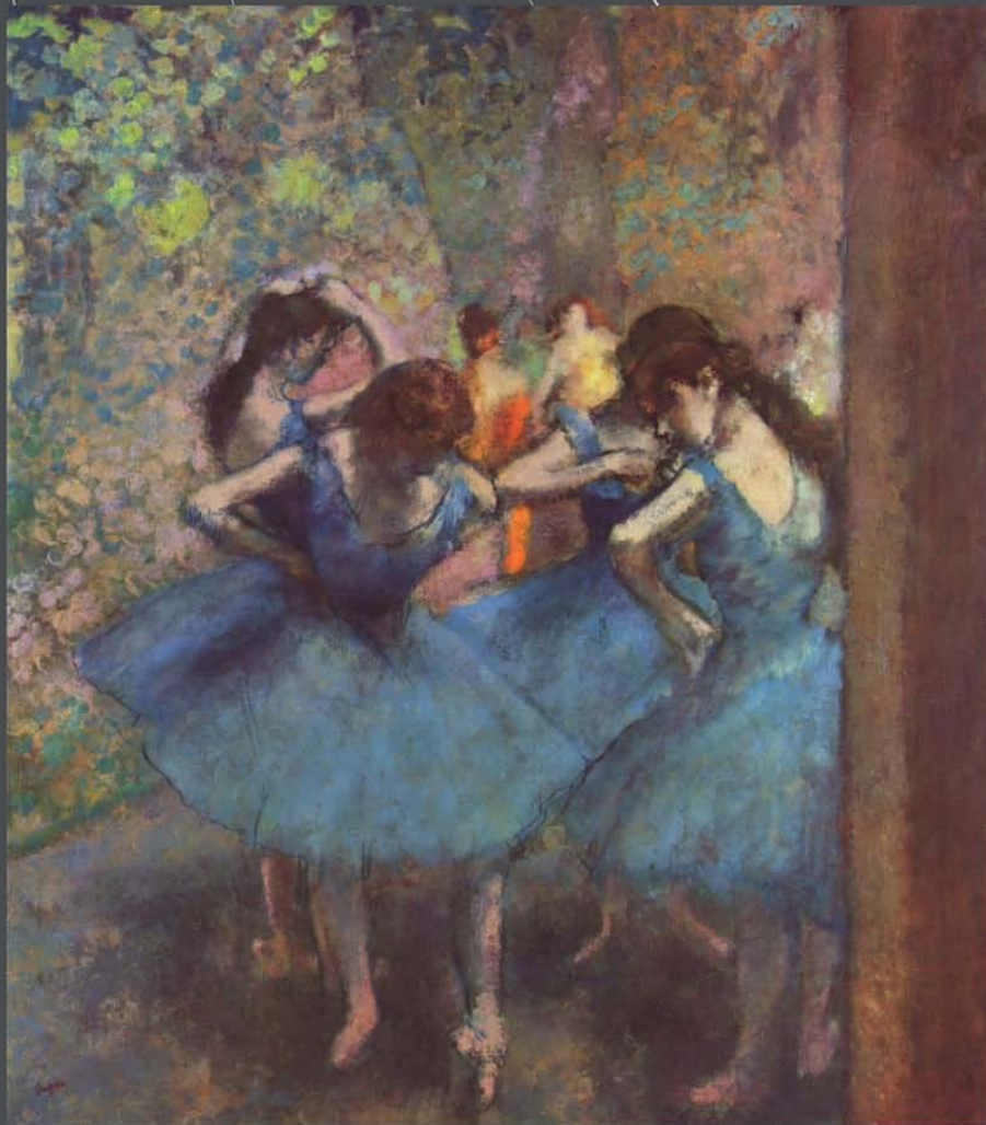
Талант работает, гений творит. Р. Шуман

Lifestyle management основывается на канонах идеального сервиса, бесконечно совершенствуя ИСКУССТВО его предоставления и предугадывая желания клиента.